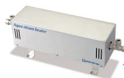
～過熱水蒸気発生器～ アクアスチームヒーター